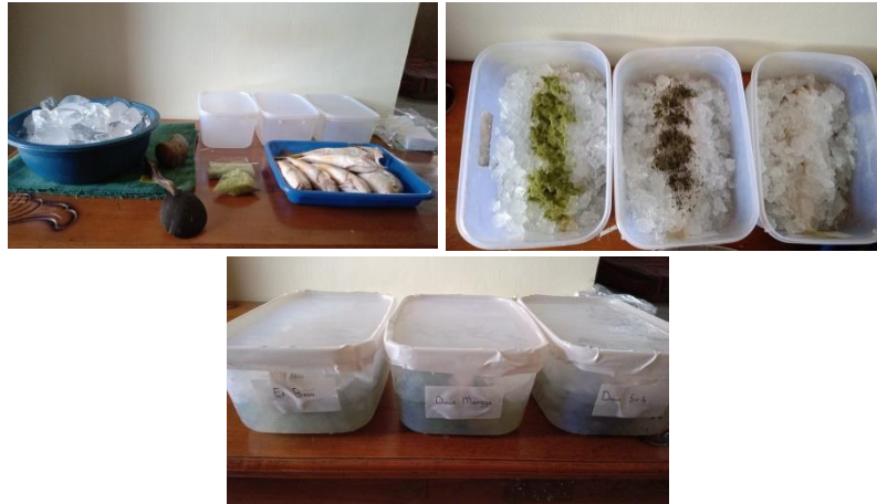
Gambar 1. Pelaksanaan uji sensorik

Dalam pelaksanaan uji sensorik, para panelis menilai fisiokimia dari sample ikan yang diberi beberapa perlakuan tersebut.