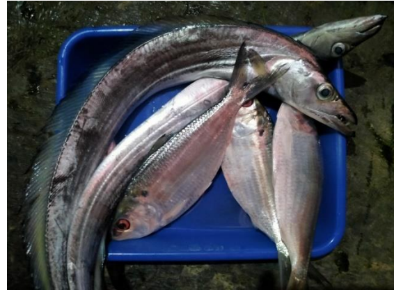
(b) Ikan diawetkan dengan es saja