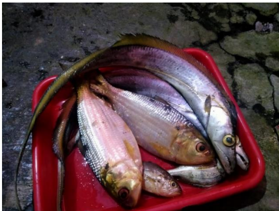
(a) Ikan diawetkan dengan es dan daun mangga

Berdasarkan pengujian sebelumnya, dilakukan uji coba di lapangan dengan meminta nelayan yang melaut untuk membawa es dan simplisia daun mangga dan 2 (dua) wadah dengan rincian, satu wadah untuk ikan yang diawetkan dengan es saja dan satu wadah dengan menggunakan es dan simplisia daun mangga dengan waktu melaut 1 hari. Setelah sampai di Tempat Pelelangan Ikan (TPI), dilakukan uji sensorik. Berdasarkan pengamatan beberapa orang panelis, diperoleh data seperti pada Tabel 8.