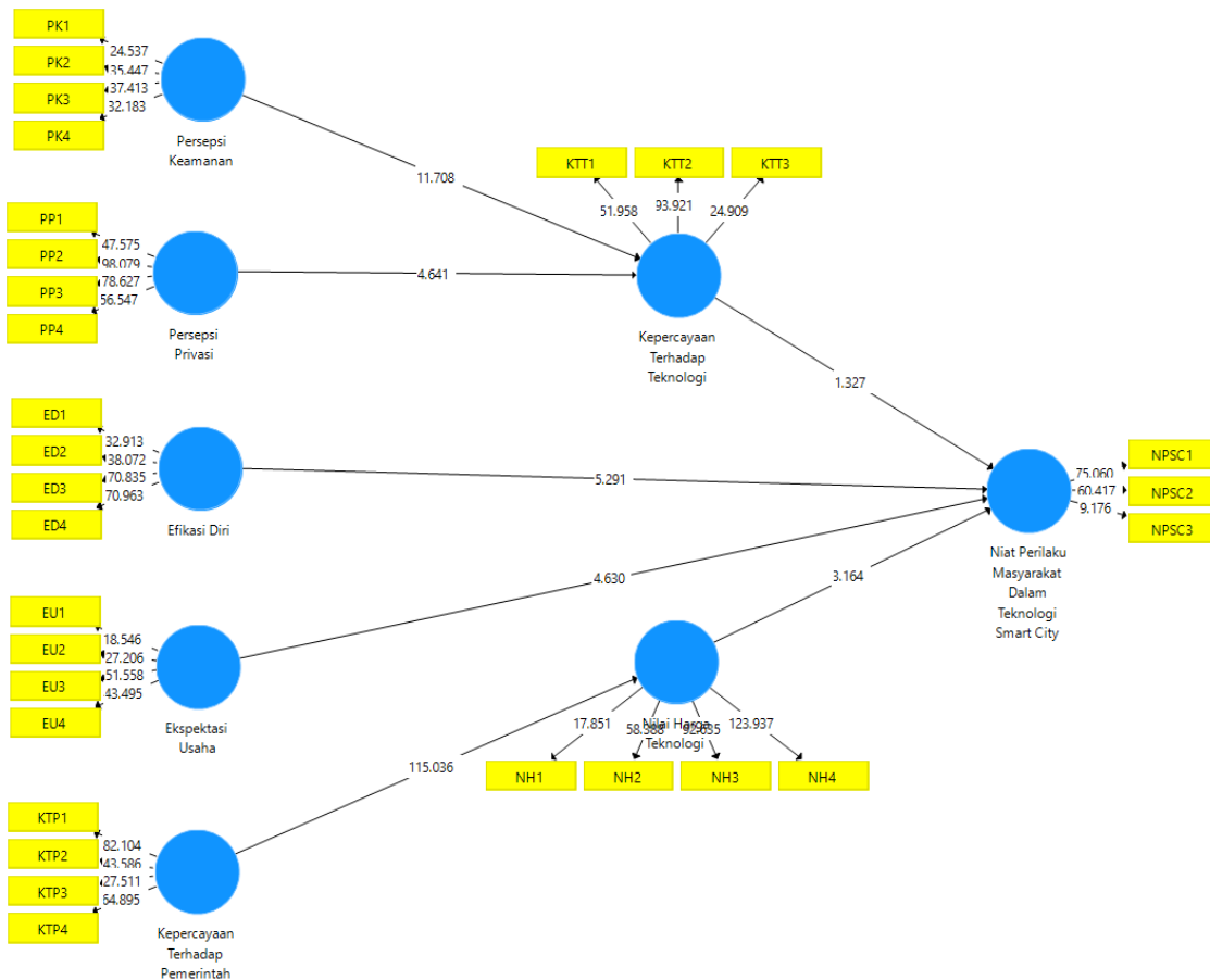
Gambar 2: Output pengujian Bootstrapping

Terdapat tujuh hipotesis yang harus diuji, yaitu pengaruh Persepsi Keamanan (PK) terhadap Kepercayaan Terhadap Teknologi (KTT), pengaruh Persepsi Privasi (PP) terhadap KTT, pengaruh Efikasi Diri (ED) terhadap Niat Perilaku Masyarakat Dalam Teknologi Smart City (NPSC), Ekspektasi Usaha (EU) terhadap NPSC, pengaruh Kepercayaan Terhadap Pemerintah (KTP) terhadap Nilai Harga Teknologi (NH), Pengaruh KTT terhadap NPSC, dan Pengaruh NH terhadap NPSC. Pada tabel 3 ditemukan dari ketujuh hipotesis tersebut, hanya satu hipotesis yang ditolak yakni H6, dan H5 menjadi hipotesis dengan pengaruh yang terbesar dengan nilai T-Test mencapai 115,036.